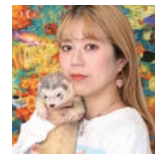
写真家 フジモリめぐみ