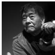
写真家 校長 ハービー・山口